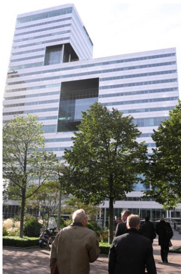
ABN-Amro bygget, 1.ste nye bygg i pågående utvikling av Amsterdam Syd.

ABN AMRO Bank N.V. fikk kniven på strupen om å flytte nærmere Schiphol Airport, eller få hovedkontoret flyttet, ikke bare ut av Amsterdam, men også ut av Nederland. Amsterdam by ga banken tillatelse til å etablere et nybygg vegg-i-vegg med en jernbanestasjon 4,5 km fra flyplassen.