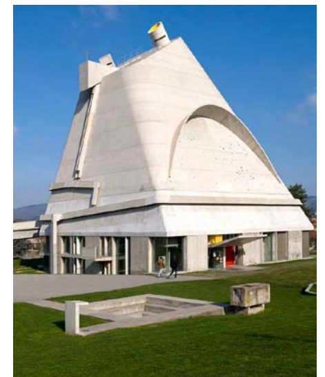
Saint-Pierre de Firminy Church, Frankrike