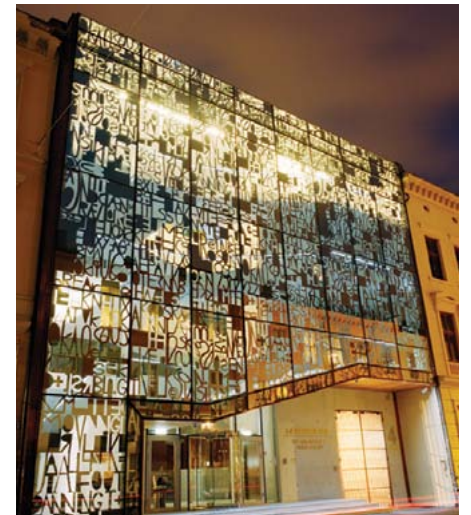
Smykkeskrinet, Foto: Element arkitekter