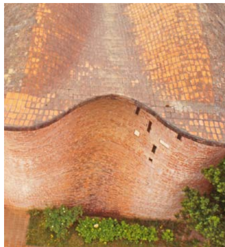
Kirken i Atlantida, Eladio Dieste