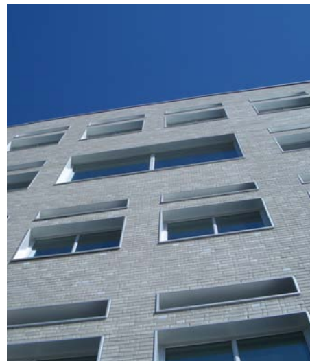
Fasade NAV Drammen